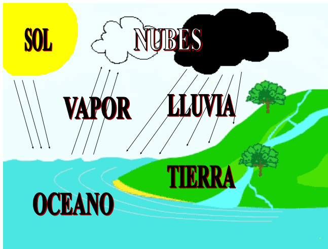
Diagrama No. 6

En el diagrama No. 6 de abajo, muestra el ciclo hidrológico del agua.